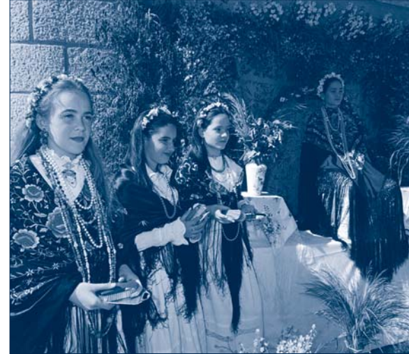
La fiesta de la Maya se celebra desde tiempos inmemoriales.

El Consejo de Gobierno de la Comunidad de Madrid, reunido el pasado jueves 17 de noviembre, adoptó el acuerdo de declarar Fiesta de Interés Turístico la celebración de la Fiesta de la Maya en el municipio de Colmenar Viejo.