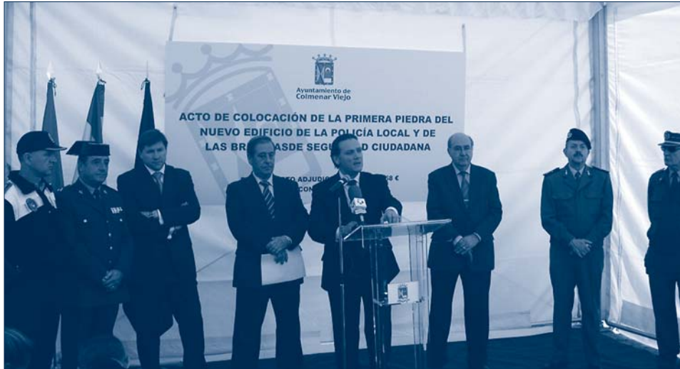
En el centro, el Consejero de Justicia; a su derecha, el Alcalde y, a su izquierda, el Concejal de Policía Local, acompañados de representantes de las Fuerzas de Seguridad del Estado y del Ejército