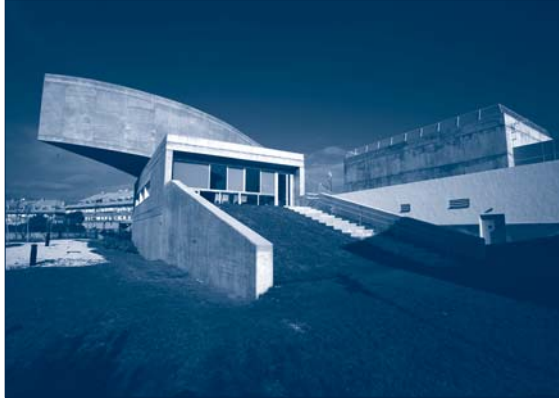
La nueva instalación tiene 2.300 m 2 de superficie repartidas en tres plantas