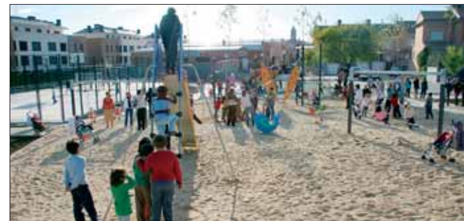
El área de juegos infantiles hizo las delicias de los más pequeños.

Más de 500 niños y padres estrenaron el pasado 24 de octubre el Parque de Prado Tito, una nueva zona de esparcimiento y recreo de más de una hectárea de superficie en cuya construcción la Concejalía de Medio Ambiente ha invertido 526.156 €.