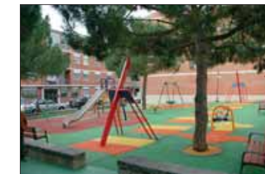
Aspecto del nuevo Parque de la calle Vascongadas.

Los vecinos del barrio de La Magdalena ya disfrutaban también de un nuevo parque entre las calles de Vascongadas y de Extremadura en el que la Concejalía de Medio Ambiente se ha gastado 100.122 €. La actuación ha consistido, fundamentalmente, en la instalación de nuevos y divertidos juegos infantiles (en función de las edades de los niños) y mobiliario urbano.