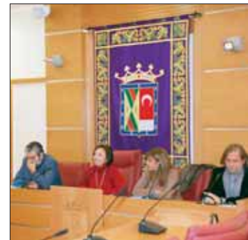
Momento de la presentación del estudio, en el Ayuntamiento.

La Concejalía de Sanidad de Colmenar Viejo, a través del Centro de Atención Integral de Drogodependencias (CAID) de la localidad, ha elaborado un estudio sobre los hábitos de comportamiento y los estilos de vida de los adolescentes del municipio, una radiografía actual y fidedigna de los 2.275 jóvenes de entre 12 y 17 años que cursan de 1º a 4º de la ESO y 1º de Bachillerato en el municipio