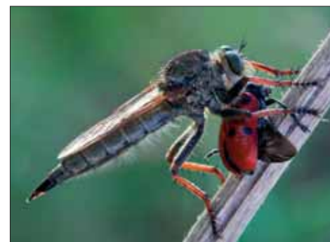
Imagen ganadora del Premio AEFONA.

También fue especialmente numerosa la presentación de imágenes cuya temática giró en torno al agua, gracias, sobre todo, al Premio Luz Murube-Zoea.