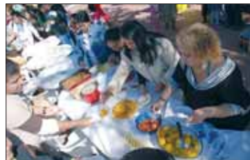
Fiesta de la Convivencia celebrada junto a la Plaza de Toros.

Ese escenario se convirtió durante horas en el lugar de encuentro de muchas personas, de dentro y fuera de nuestras fronteras, que quisieron compartir, además de sus culturas, costumbres y experiencias, los platos típicos de sus países de origen, un magnífico ejemplo de interculturalidad participativa.