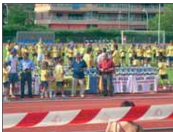
Entrega de trofeos de la Escuela al final de la temporada 2007-2008.

La Federación de Fútbol de Madrid ha otorgado a la Escuela de Fútbol 'Siete Picos Colmenar' el Premio a la 'Mejor Escuela de Fútbol' del año y al equipo de Cadetes A de esta Escuela el Premio al 'Mejor comportamiento deportivo', un galardón, este último, que comparte con conjuntos y aficiones de otras Escuelas y Clubes madrileños.