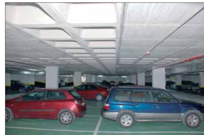
Decenas de usuarios del tren ya disfrutaron gratuitamente del nuevo parking disuasorio.