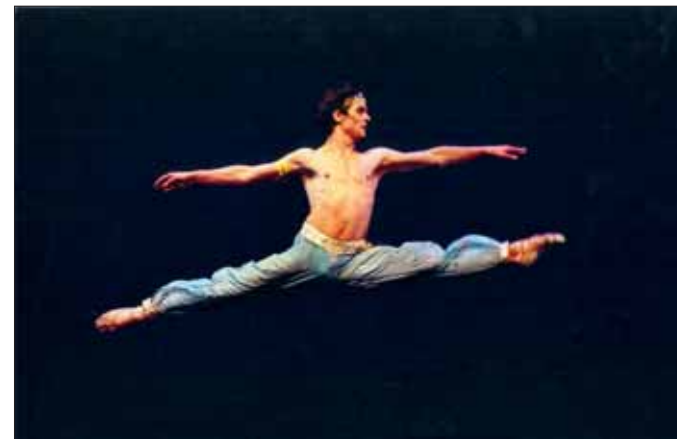
El bailarín Ángel Corella durante un momento de su actuación en 'Corsar'.

de toros Agapito García González Serranito.