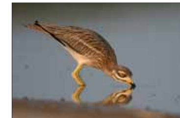
Una de las imágenes ganadoras en la Modalidad 'Reportaje'.

El Certamen Fotográfico Medio Ambiente 2008 ha vuelto a afianzarse este año como uno de los mejores concursos de fotografía de nuestro país dedicados a la naturaleza.