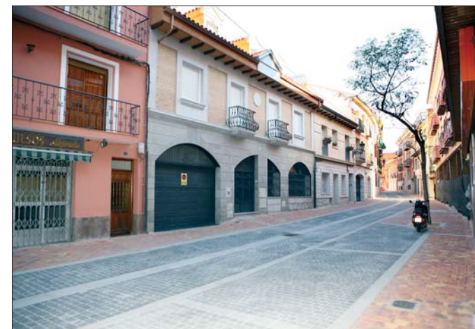
Imagen de las remodeladas calles Dr. González Serrano y Retama.

de un nuevo colector de 500 mm y la sustitución de las antiguas tuberías de fibrocemento por otras de hierro fundido; y la mejora del alumbrado público, posibilitando el soterramiento, en un futuro, de los tendidos eléctricos aéreos actuales.