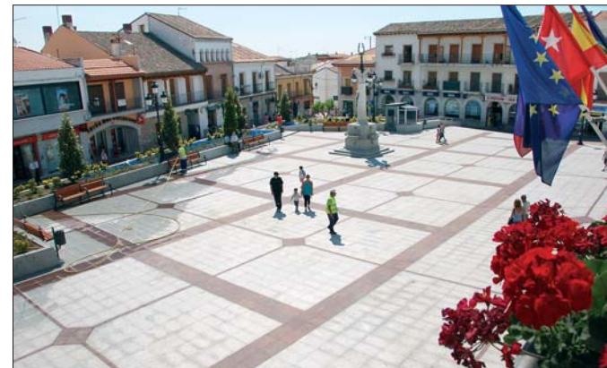
Aspecto de la Plaza del Pueblo tras su remodelación.

El pasado 30 de julio más de 500 vecinos no quisieron perderse la inauguración oficial de las obras de remodelación de la Plaza del Pueblo, una actuación que ha incluido la construcción de un aparcamiento bajo este espacio y que ha supuesto una inversión de 2.137.625 €.