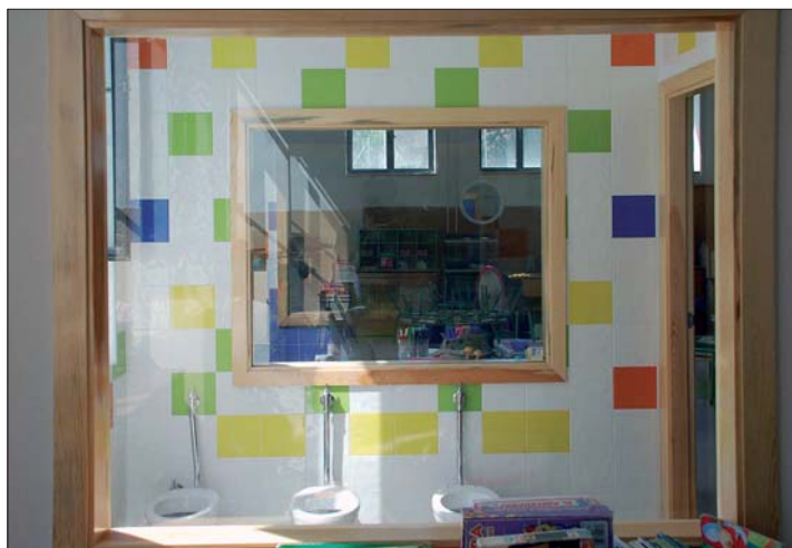
Uno de los nuevos aseos creados en el CEIP Soledad Sainz este verano.

La Comunidad de Madrid y el Ayuntamiento de Colmenar Viejo, a través de la Concejalía de Educación, han llevado a cabo una serie de mejoras en los Centros Educativos de Infantil y Primaria públicos de la localidad, aprovechando las vacaciones escolares, cuyo coste total asciende a 293.197 €, de los que el Consistorio colmenareño ha aportado 202.552 € y el resto, 90.645 €, la Consejería de Educación de la Comunidad de Madrid.