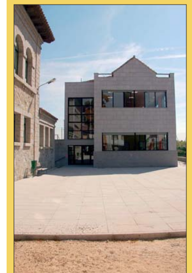
Nuevo aula del CEIP Soledad Sainz.

También ha invertido 16.218 € en la reforma de los aseos de alumnos de la zona del comedor del C.E.I.P. Isabel la Católica; y 4.272 € en la eliminación de la rampa que comunica la zona de juegos infantiles con la pista deportiva (elevando la cota y añadiendo ésta a la zona infantil), dotándola de cerramiento y puerta, del Colegio de Educación Especial Miguel Hernández.