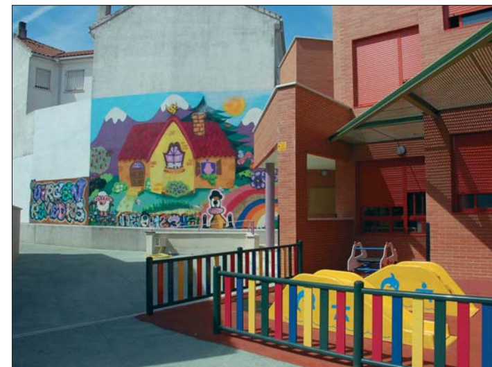
El patio del pabellón infantil del CEIP Virgen de Remedios tras las obras.

La planta baja del nuevo inmueble se destinará a comedor y a office y la planta primera, una gran sala diáfana, para usos múltiples. Además, la Consejería de Educación está llevando a cabo también la ampliación del comedor del C.E.I.P. San Andrés.