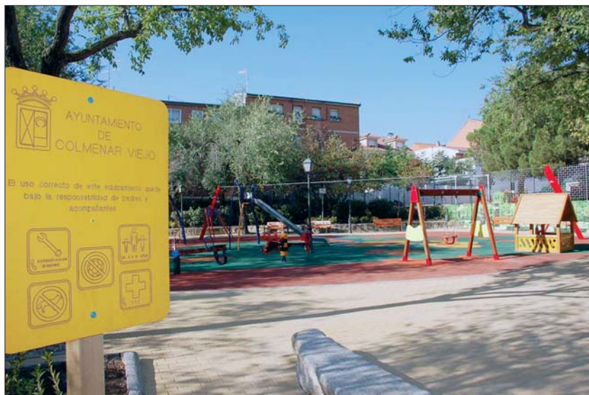
El Parque de los Derechos Humanos tras su reforma.

Los vecinos de la localidad, sobre todo los más pequeños, ya disfrutaban del recién remodelado Parque de los Derechos Humanos, en cuyas obras el Ayuntamiento colmenareño ha invertido 187.177,50 €.