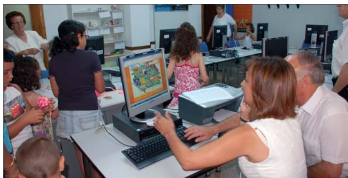
Abuelos y nietos disfrutaron de los lindo navegando por internet.