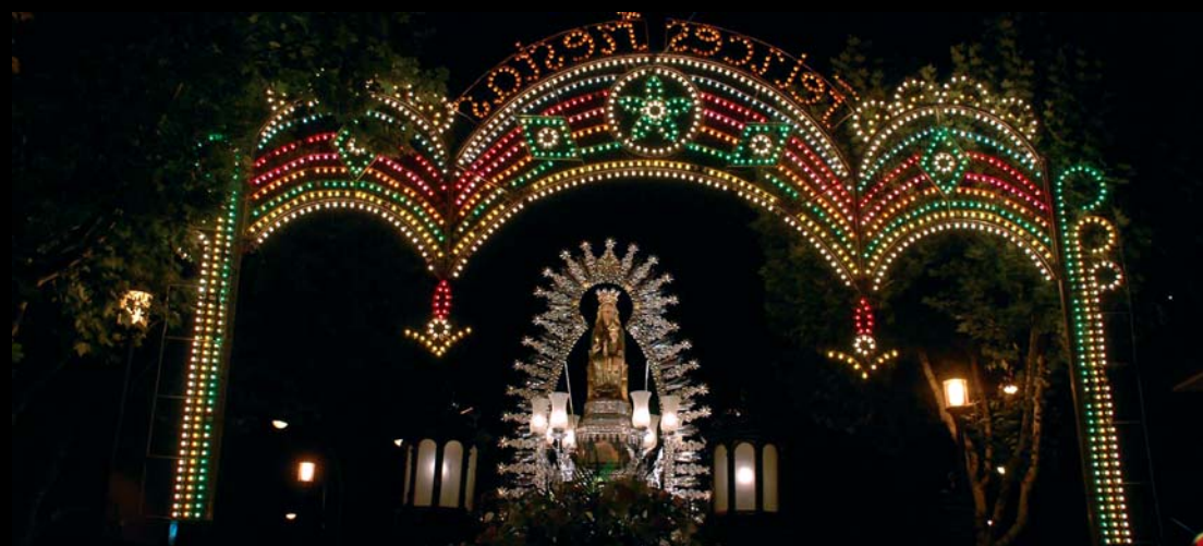
La llegada de Nuestra Señora de Los Remedios al Canto de la Virgen es el momento más emotivo de las Fiestas Patronales.