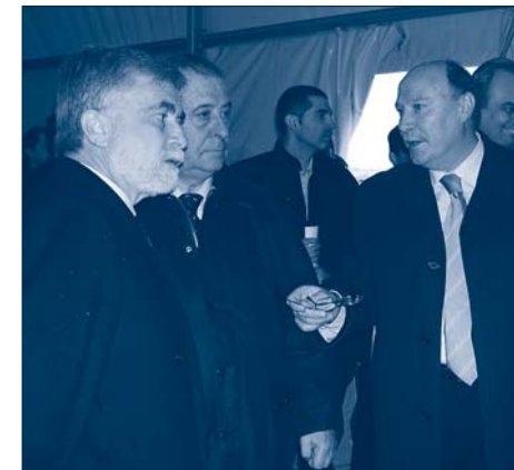
Mariano Zabía, Consejero de Medio Ambiente y Ordenación del Territorio; José María de Federico, Alcalde de Colmenar Viejo y Ángel Arroyo, Gerente del Consorcio Urbanístico de La Estación.

En el caso de Colmenar Viejo, los requisitos básicos que se exigirán son los siguientes: no tener vivienda en propiedad; ser menor de 35 años en el momento de entrega de la vivienda; estar empadronado en Colmenar Viejo al menos desde antes del 1 de enero de 1999 y, por último, no tener ingresos superiores a 5,5 veces el salario mínimo interprofesional.