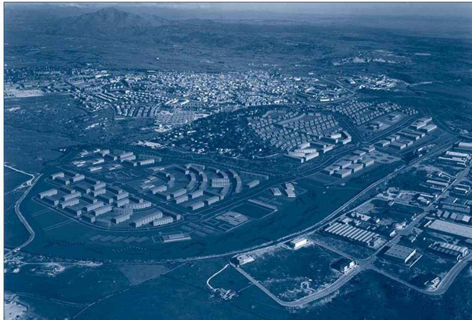
Imagen virtual que muestra cómo irán situadas las futuras viviendas en los terrenos del Consorcio