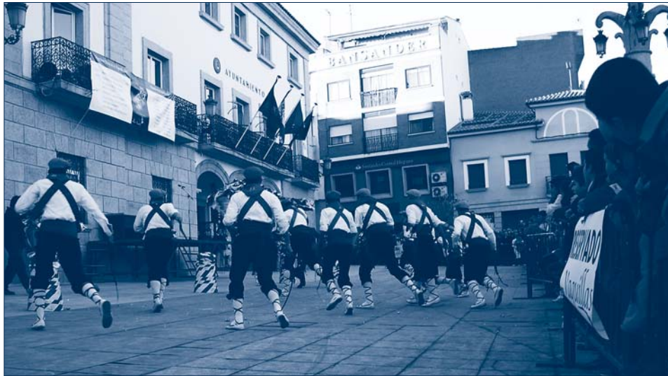
Como cada 2 de febrero, desde tiempos inmemoriales, los mozos exhiben el arte heredado en la Plaza del Pueblo

El pasado día 2 de febrero, 23 “vaquillas” recorrieron las principales calles de Colmenar Viejo escenificando la vida del ganado en el campo. Se trata de una tradición que podría tener sus orígenes en el siglo XIII y que, debido a su gran vistosidad y colorido, cada vez cuenta con más visitantes. Más de mil personas presenciaron esta fiesta considerada de interés turístico, aprovechando la buena tarde que acompañó a los vaquilleros.