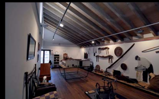
Espacio para las costumbres, oficios y tradiciones.

El Lagar y la Bodega de la Casa Museo es un testimonio inmejorable de aquellos lugares donde se elaboraba el vino en la localidad.