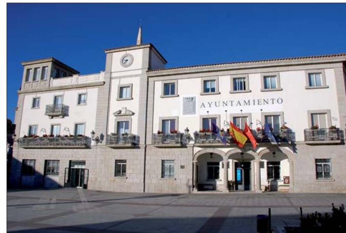
En 2011 el Ayuntamiento no subirá las tasas ni los precios públicos.

El Ayuntamiento de Colmenar Viejo contará en 2011 con un Presupuesto Municipal consolidado que asciende a 33.719.185 €, una cifra que refleja el cumplimiento de las reglas de oro de la literatura financiera en una situación de crisis económica como la actual: partir de unas cuentas saneadas, mantener un equilibrio financiero y realizar un esfuerzo inversor como recompensa de una correcta gestión en ejercicios pasados gracias a los saldos positivos en remanentes de crédito.