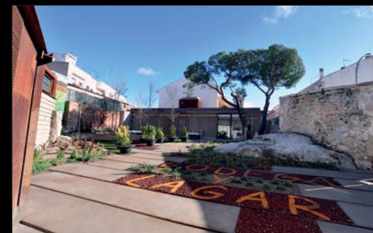
Vista del jardín de la Casa Museo de la Villa.