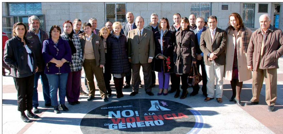
La Corporación en pleno dijo NO! A la Violencia de Género.