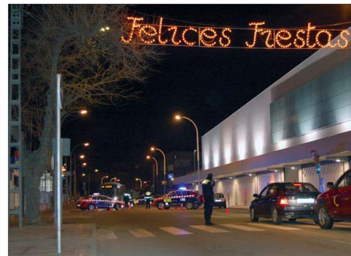
Imagen de archivo de los controles que realiza la Policía Local.

Para realizar este trabajo, los agentes dispusieron de perros anti-droga, detectores portátiles de metales y sonómetros, entre otros elementos.