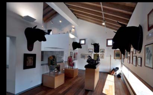
Museo Taurino Municipal.