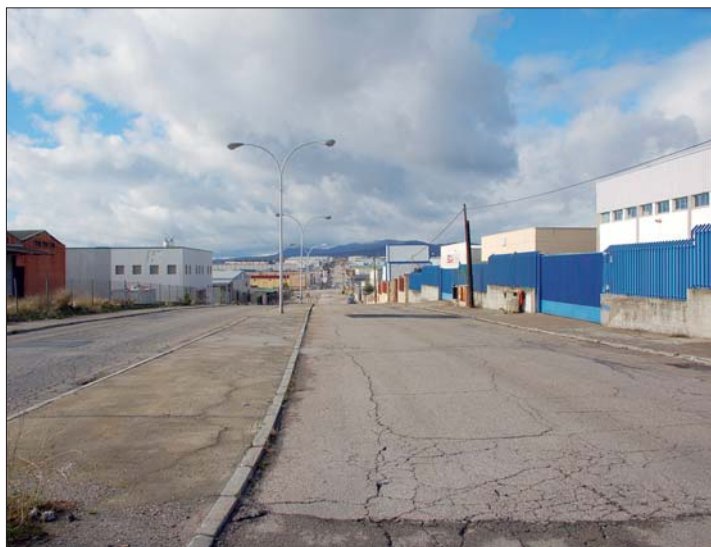
La mejora de la pavimentación e iluminación del Polígono Sur es una de las actuaciones previstas en el capítulo de inversiones del Presupuesto 2011.

principios de responsabilidad y contención.