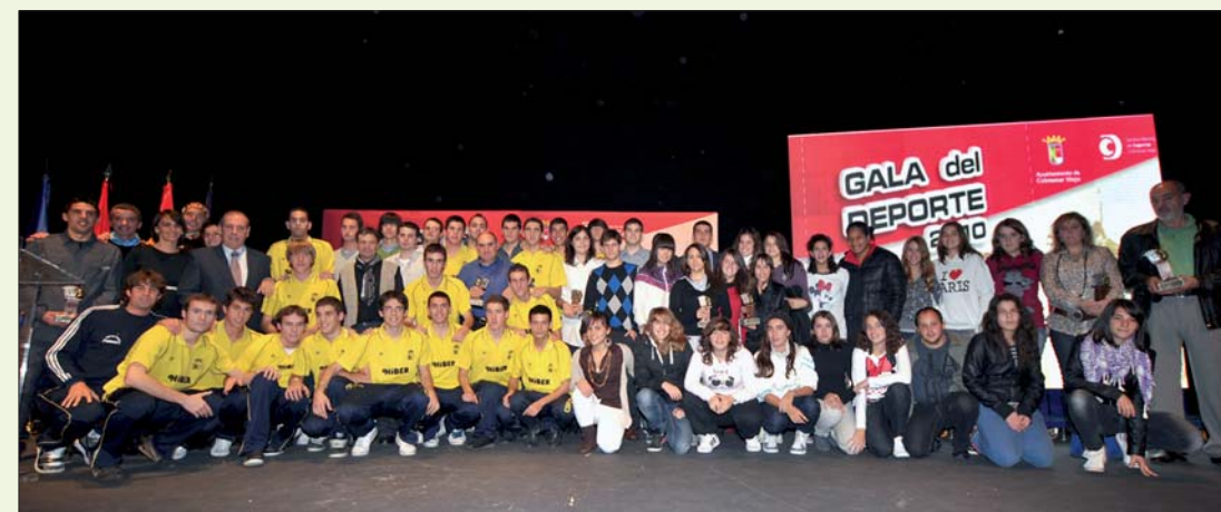
Foto de 'familia' con todos los premiados en la Gala del Deporte 2010.

Rendir homenaje a los deportistas locales más destacados del momento que por sus relevantes méritos en el mundo del deporte -en disciplinas como el atletismo, la natación, el judo o el fútbol, entre otras- merecen un reconocimiento público.