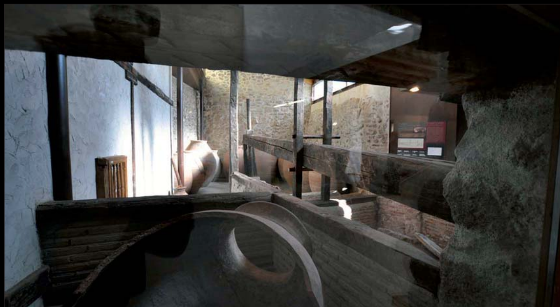
La Casa Museo reseva un espacio muy especial para el lagar, la bodega y el recuerdo de la producción del vino en la localidad.

El 22 de noviembre de 1504 el Rey Fernando el Católico otorgó a Colmenar Viejo el Privilegio de Villazgo por el cual esta población quedaba apartada de la jurisdicción de Manzanares el Real (cabecera del condado por aquella época).