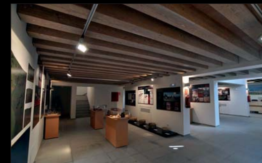
'Descubriendo en Pasado'.

Dos salas dedicadas a las ' Costumbres, Oficios y Tradiciones ' invitan a los visitantes a conocer el pasado de la localidad desde lo más cotidiano a nosotros.