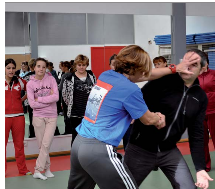
En el Taller de Defensa, las mujeres aprendieron cómo repeler una posible agresión incluso con elementos como un paraguas.

En el documento, todos, de forma unánime, manifestaron, entre otras cosas, que la sensibilización, la educación y la igualdad de oportunidades resultan instrumentos fundamentales "y en ello trabajamos las administraciones día a día, para afrontar el futuro con confianza. Pero también estamos ahí para prestarles apoyo integral a las víctimas cuando el problema ya se presenta, para que sepan que no están solas, que hay salida y que cuentan con el respaldo de todos, las asociaciones, las ONGs, todas aquellas personas de