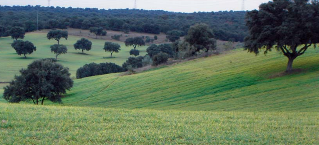
Dehesa agrícola en las Pueblas.