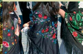
Para la Maya que es bonita y galana