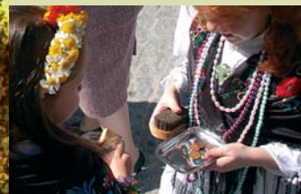
Eche mano al esquero el caballero